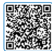
Der vollständige Bericht der Ethik-Kommission.

Ähnliche Szenarien dominieren die aktuelle politische und gesellschaftliche Diskussion zum Thema »autonomes Fahren«, das wiederum wesentliche Fragestellungen der Social Networked Industry tangiert. Auch wenn die technischen Möglichkeiten greifbar sind und deren ökonomische Sinnhaftigkeit dargelegt werden kann, sind es vor allem die ethischen Fragen zu softwarebasierten Entscheidungen der Technik in Kollisionsfällen, die weiterer Klärung bedürfen. Aufgrund der Komplexität der Antworten hat der Bundesminister für Verkehr und digitale Infrastruktur eine Ethik-Kommission »Automatisiertes und Vernetztes Fahren«, eingesetzt. Diese hat im Juni 2017 einen Bericht vorgelegt, in dem sie 20 ethische Regeln aufstellt, unter anderem: »Der Schutz von Menschen hat Vorrang vor allen anderen Nützlichkeitsabwägungen.« (Auszug These 2) sowie »Bei unausweichlichen Unfallsituationen ist jede Qualifizierung nach persönlichen Merkmalen (Alter, Geschlecht, körperliche oder geistige Konstitution) strikt untersagt. Eine Aufrechnung von Opfern ist untersagt.« (These 9) [13]. Obwohl oder gerade weil autonome Fahrzeuge im Massenmarkt lange noch nicht angekommen sind, müssen Expertenkommissionen wie diese Leitplanken für die softwaretechnische Weiterentwicklung etablieren.